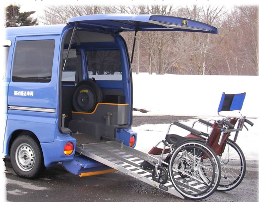
スロープで乗降します。