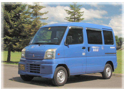
青色の軽ワゴン車で伺います。